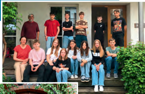
Auf der Konfi-Fahrt nach Hamburg.