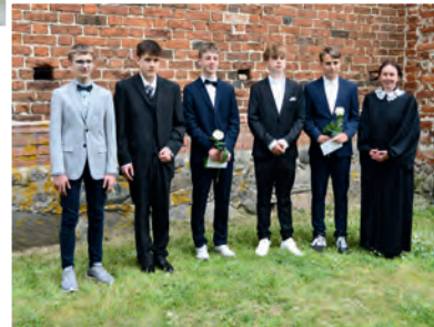
Konfirmierte in Beidendorf zu Pfingsten.