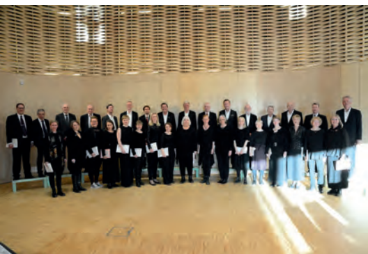
Cantores Hilares, 2019.

am 4. Oktober um 19.00 Uhr in der Dambecker Kirche