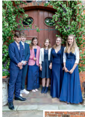
Konfirmierte in Hohen Viecheln zu Pfingsten.