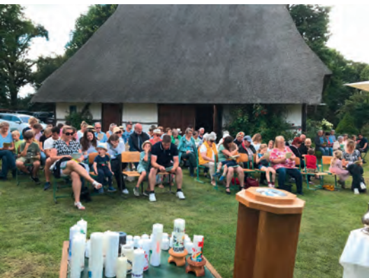
Tauferinnerungsgottesdienst der Unterregion in Dambeck.

Wir suchen jemanden, der die Mäharbeiten auf dem Beidendorfer Friedhof an der Kirche übernehmen kann? Aufsitzmäher und Motorsense sind vorhanden. Die Entlohnung folgt nach Absprache. Bitte bei Interesse melden, unter: 038424 20309.