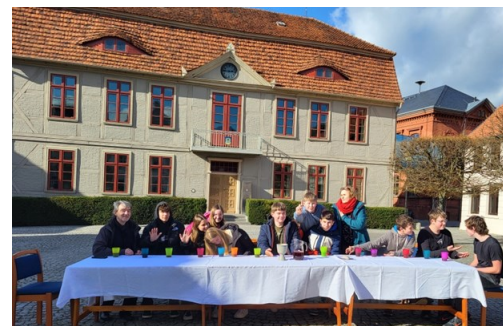
Das letzte Abendmahl (L. Da Vinci) nachgestellt vorm Malchower Rathaus

An einem Wochenende im April machten wir uns gemeinsam mit 18 Konfirmand*innen aus der Region auf den Weg ins Freizeithaus nach Prillwitz. Unser Motto für 3 Tage war: Vom Steine sammeln und Steine wegwerfen . Am ersten Abend gab es eine Vorstellungsrunde zu mitgebrachten Steinen und es wurden Steingeschichten erzählt. Rund ums Thema Steine ging es auch in den Arbeitseinheiten und 3 Workshops. Im Workshop