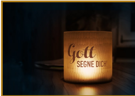
Schwarz © GemeindebriefDruckerei.de