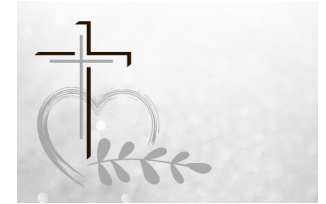
Schwarz © GemeindebriefDruckerei.de

Ihr habt jetzt Trauer, aber ich werde euch wiedersehen und euer Herz wird sich freuen.