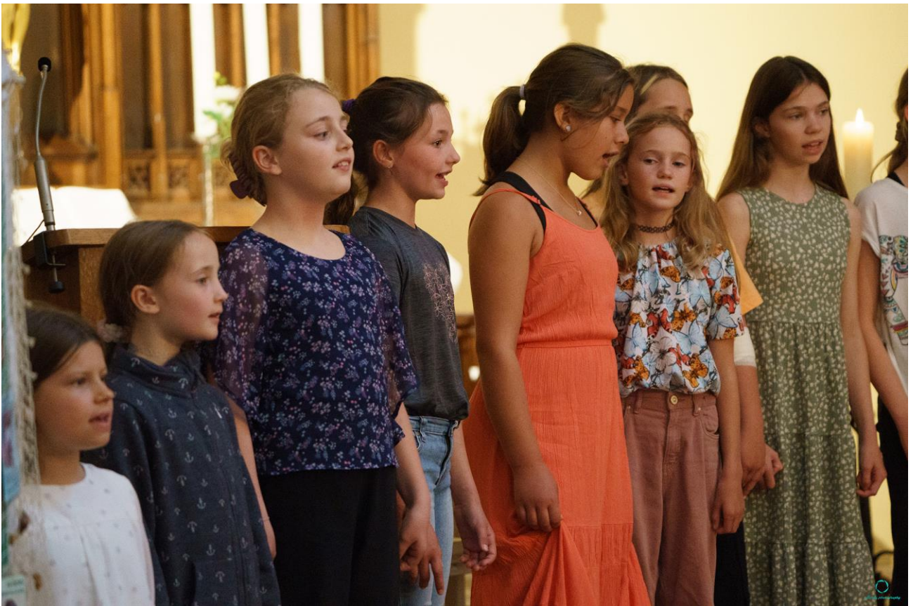
Georgensingschule Waren