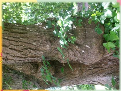
auf dem Friedhof Bernitt