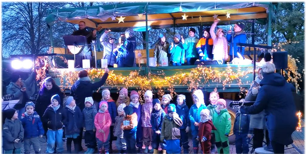
„LichterKinder ...“ (Martinsandacht auf dem Traktor-Anhänger an der Kita Jürgenshagen 2023)

Freitag, 8. November, 17 Uhr (Ablauf und Stationen werden noch abgestimmt)