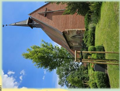
auf dem Friedhof Hohen Luckow

An diesem Platz unseres Gemeindebriefes werden Details der Kirchen in unserer Pfarisprengel vorgestellt. In dieser Ausgabe: Markante Bäume