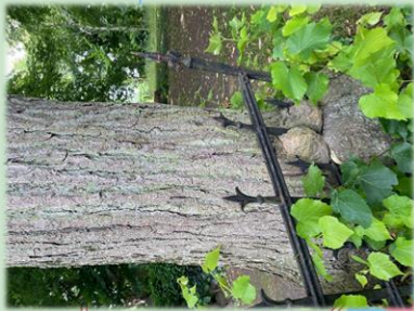
auf dem Friedhof Neukirchen