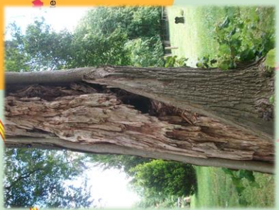
auf dem Friedhof Moissall