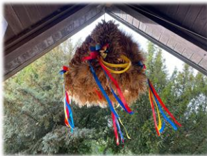
Erntedank in der Kirche Hohen Luckow