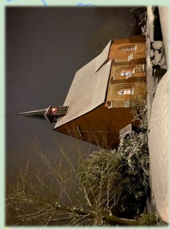
Kirche Hohen Luckow