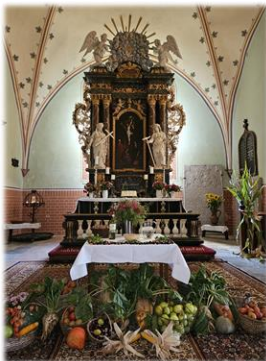
Erntedank in der Kirche Neukirchen