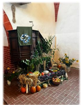
Erntedankbank an der Bernitter Kanzel