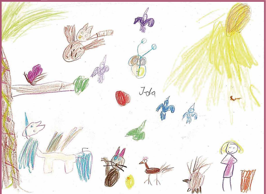
Ida Sündermann, 7 Jahre

Welcher große oder kleine Mensch gestaltet das nächste Titelbild für den Gemeindebrief?