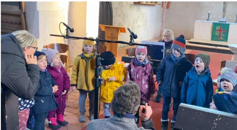
Kinder der Kita „Dorfstrolche“ Faulenrost

Lassen Sie sich adventlich überraschen! Vielleicht gibt es auch schon Anregungen für den digitalen Adventskalender 2023?