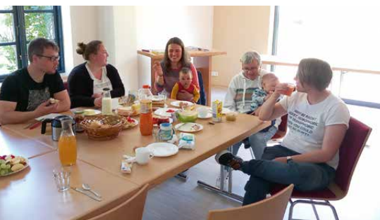
Traum: Ein Raum, in dem sich Jung und Alt begegnen, in dem Ideen gesponnen und Erfahrungen ausgetauscht werden, an dem jeder satt wird an Leib und Seele. Jeder darf kommen und jede ist willkommen.

men. Zusammen wird es schön und voll und schön voll. Wer etwas Schönes im Kühlschrank oder in der Speisekammer hat, kann es mitbringen. Wer ein Lied oder eine Melodie hat genauso. Alles darf sein. Nichts muss sein. Gemeinsam für uns: Generationenfrühstück.