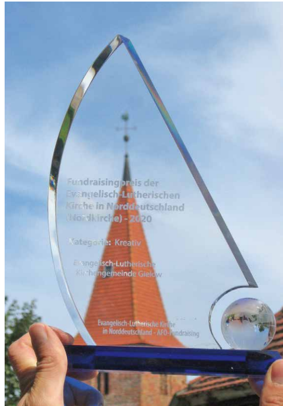
Fundraisingpreis der Evangelisch-Lutherischen Kirche in Norddeutschland (Nordkirche) 2020 Kategorie: Kreativ für die Evangelisch-Lutherische Kirchengemeinde Gielow

„Lass dir ein Nebenamt, in dem du dich als Mensch an Menschen aus gibst, nicht entgehen. Es ist dir eines bestimmt, wenn du es nur richtig willst.“