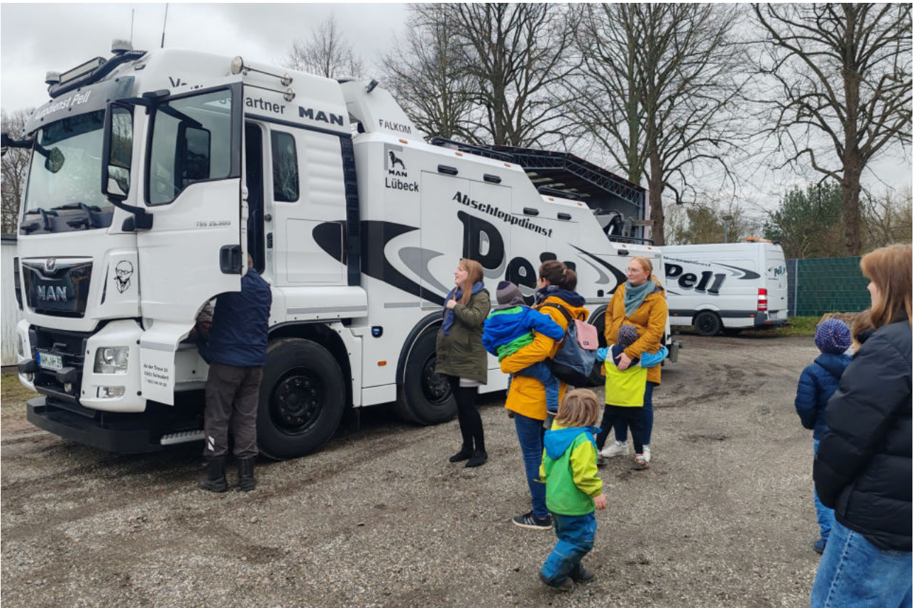
in der Autowerkstatt Pell