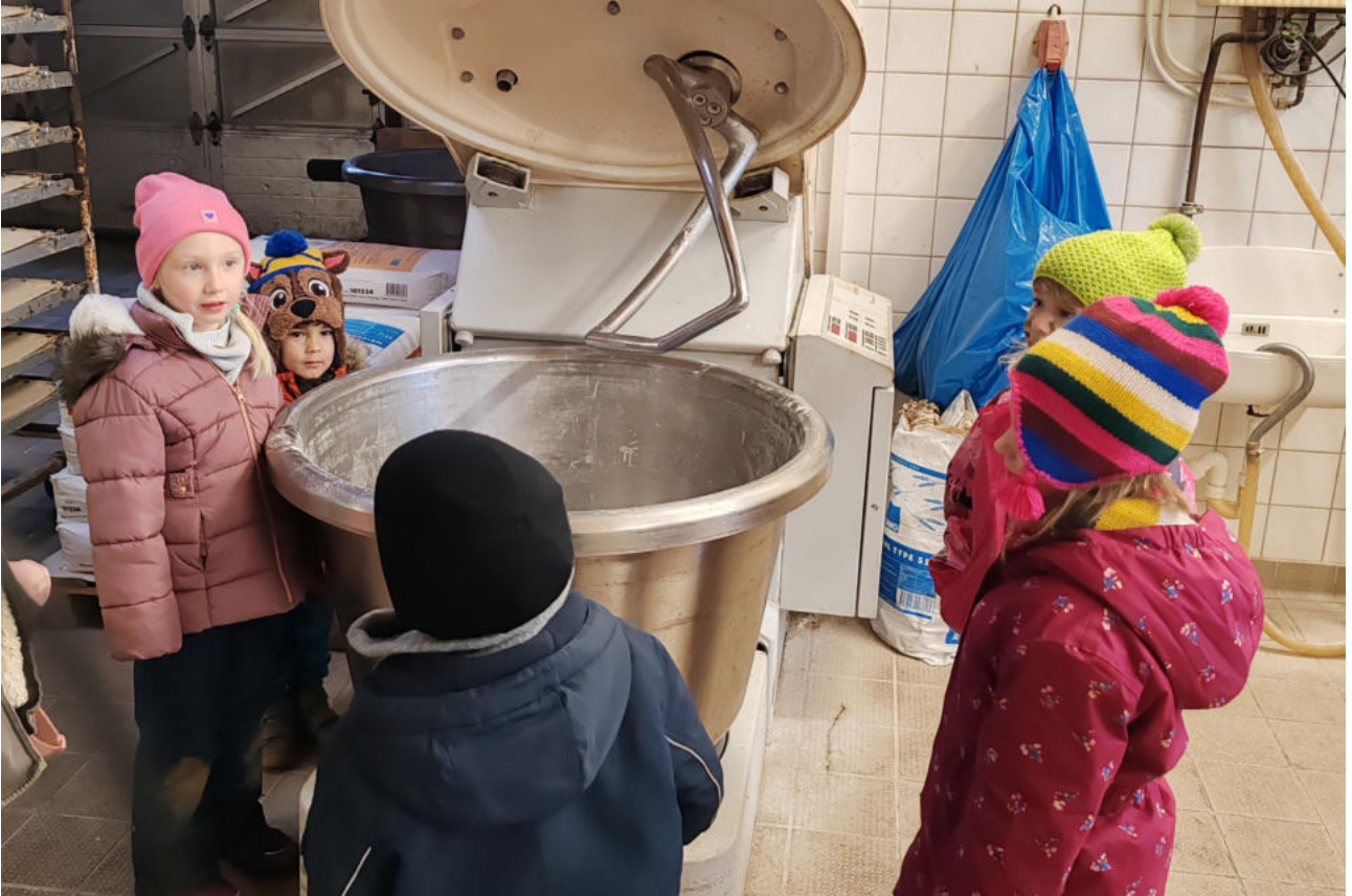
Besuch der Kirchenknirpse in der Bäckerei Kleinfeld