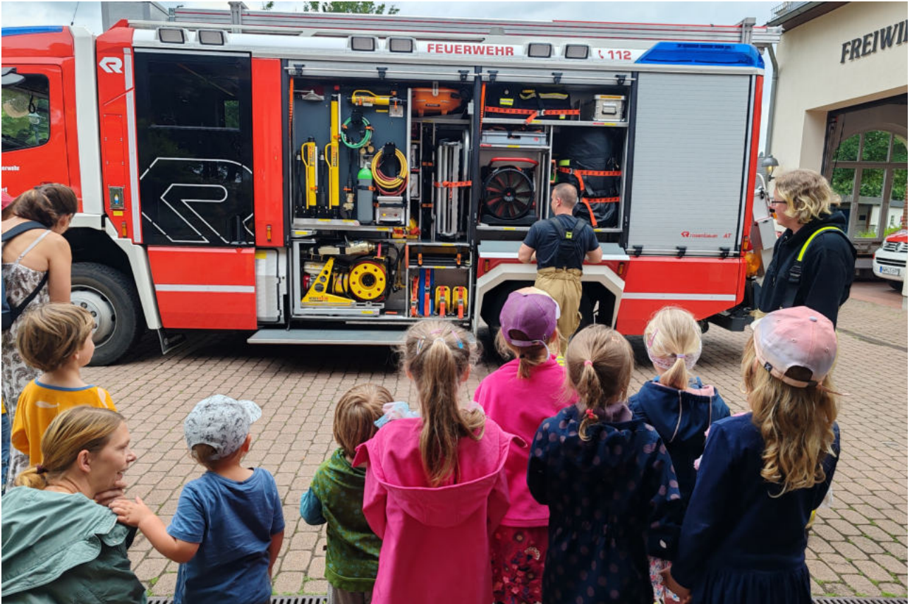
bei der Freiwilligen Feuerwehr Selmsdorf