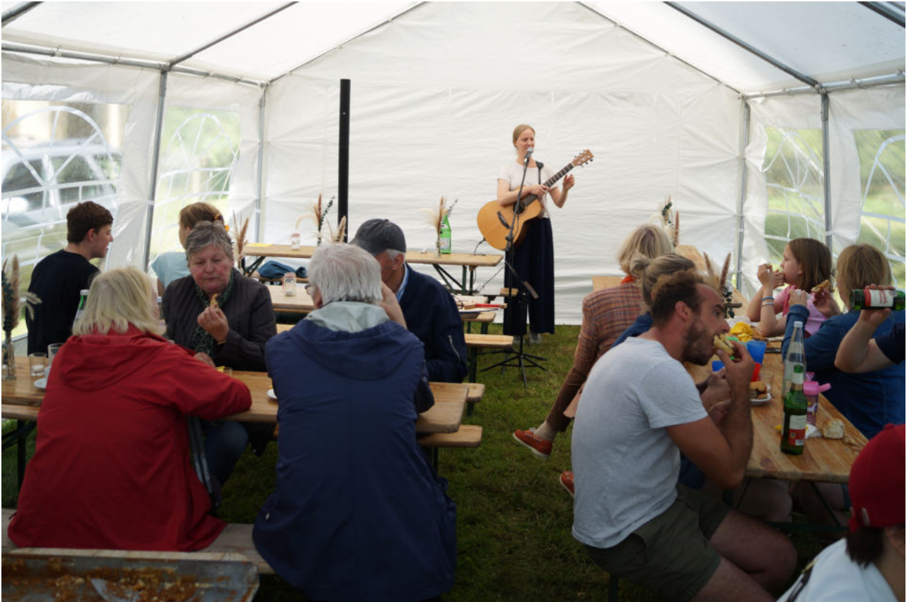
auf dem Kirchengemeindefest