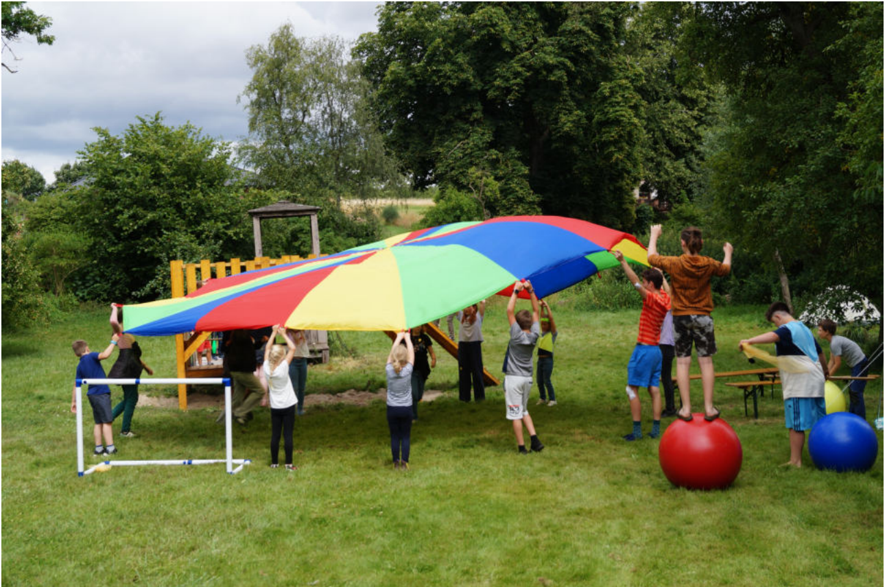
das Kinderbibelcamp in Roggenstorf