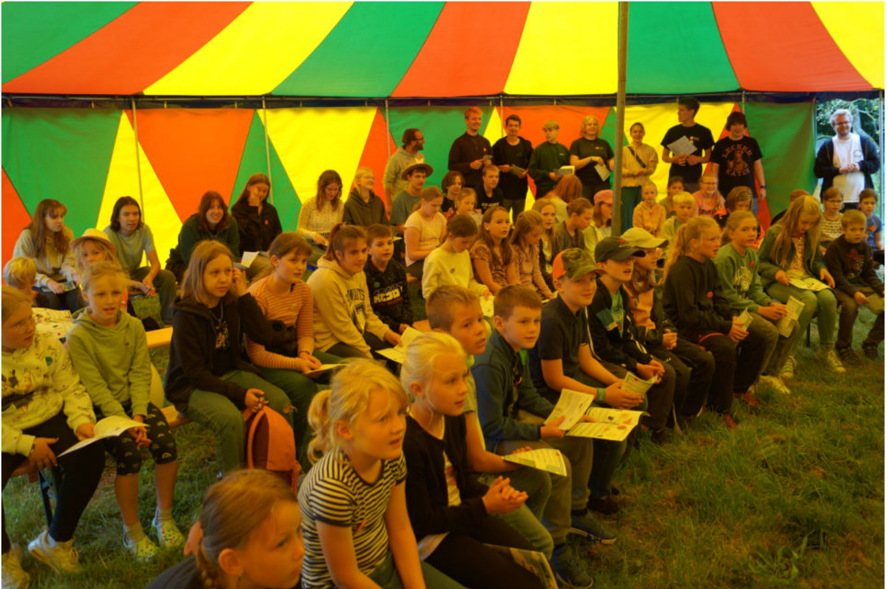
das Kinderbibelcamp in Roggenstorf