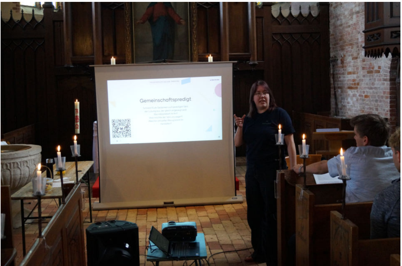
der Gottesdienst der Jungen Gemeinde