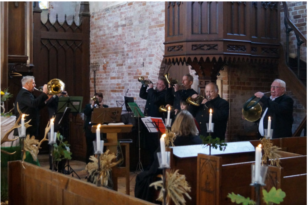
Die Hubertusmesse in der Sankt Marienkirche