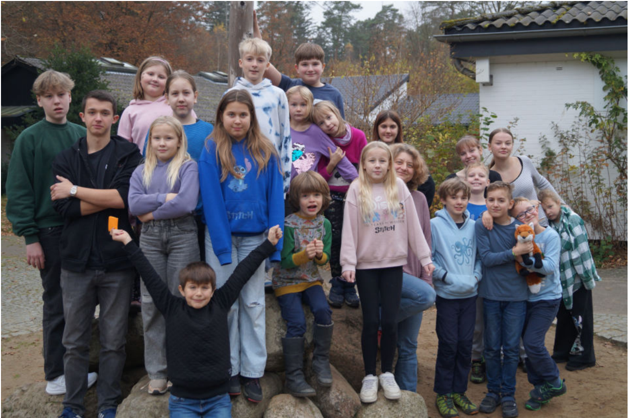
Unsere Christenlehrefahrt nach Mölln