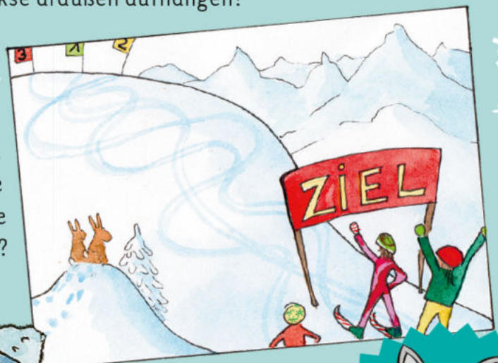
Der Skifahrer mit der Startnummer 1.

Rätsel: Wer ist im Rennen die kürzeste Strecke gefahren?