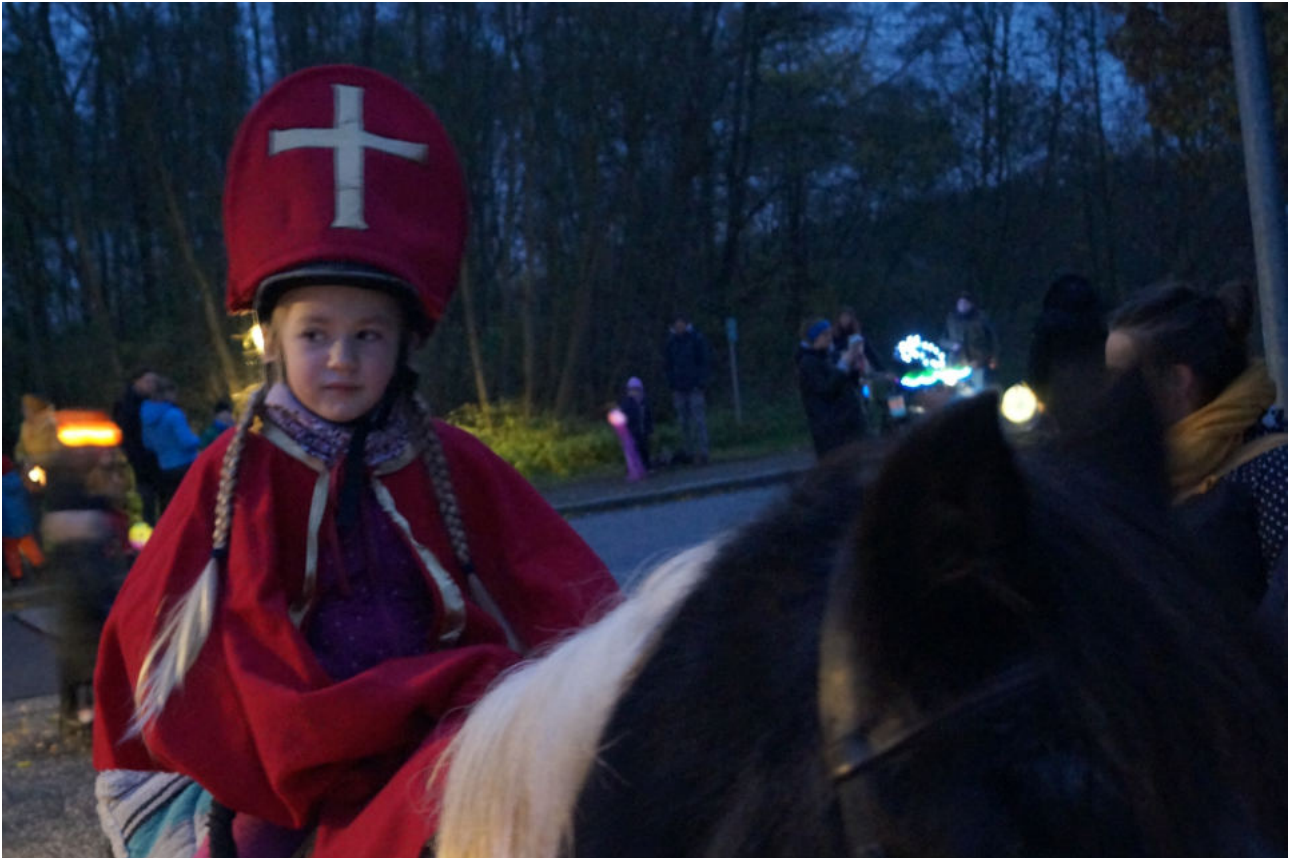
Das Sankt Martinsfest