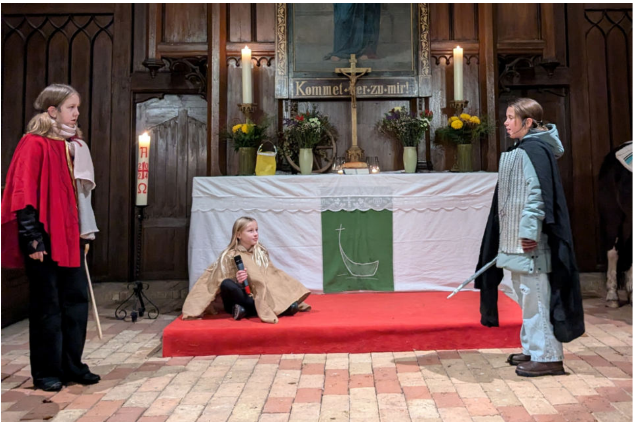
Das Sankt Martinsfest