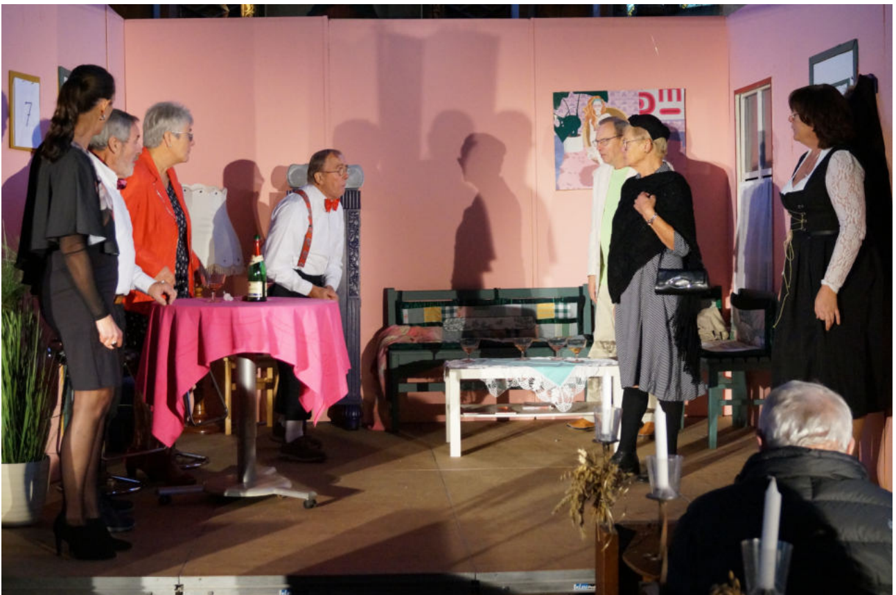
Die Schönbarger Späldäl in der Selmsdorfer Kirche