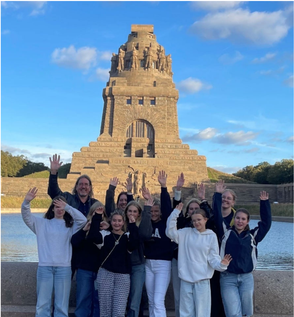
Unsere Konfirmandenfahrt nach Leipzig