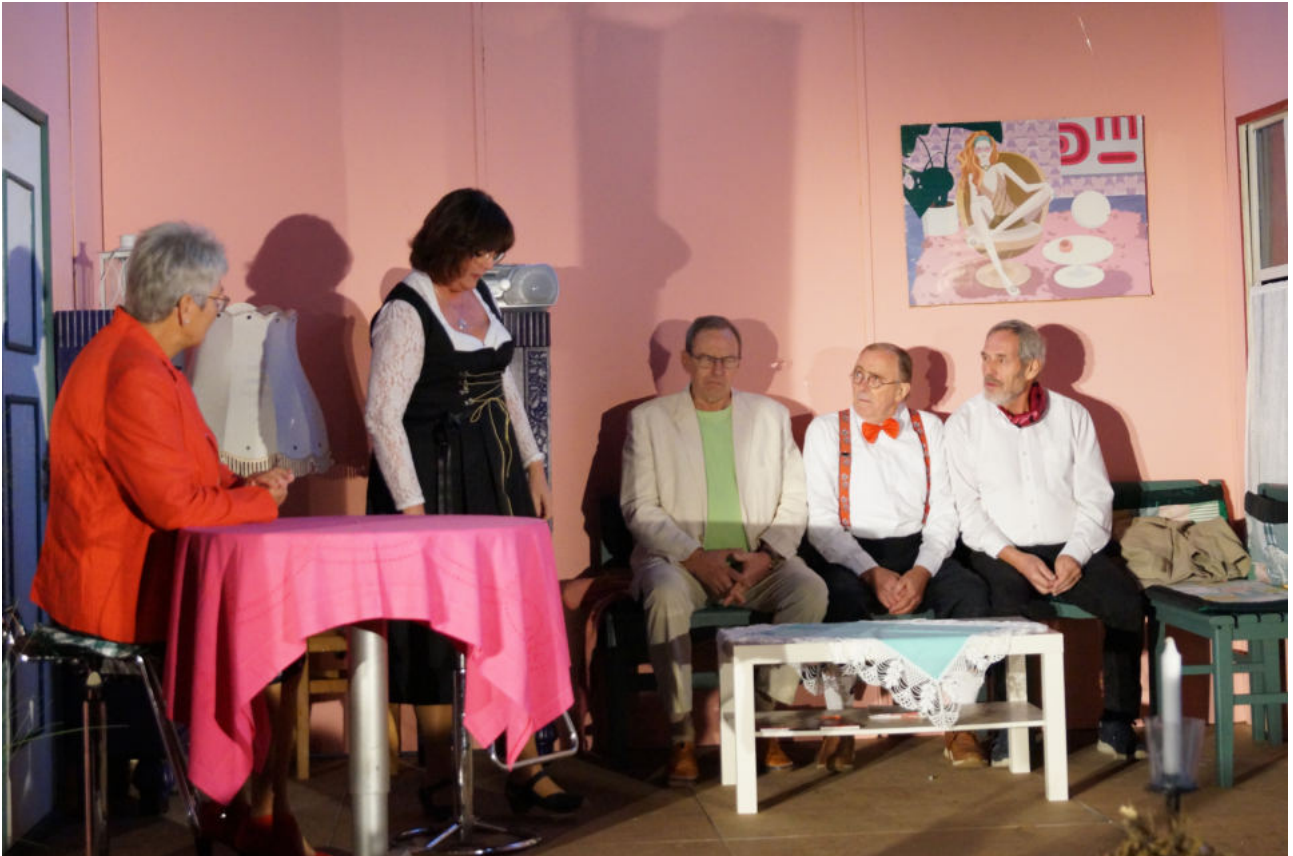
Die Schönbarger Späldäl in der Selmsdorfer Kirche