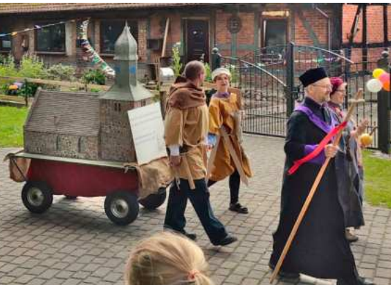
Der Festwagen mit der Kladrumer Kirche war nur einer der vielen phantasievoll geschmückten Wagen. Weiterhin präsentierten sich Sportgruppen, Firmen, der Hegering und viele mehr.

In Zölkow stärkten wir uns mit leckeren Pommes, bevor es dann zum Toben auf den Spielplatz und die Hüpfburg ging. Ein gelungener Vormittag für alle Kinder und auch für die Erwachsenen – toll, was dort auf die Beine gestellt wurde. Eure Melanie