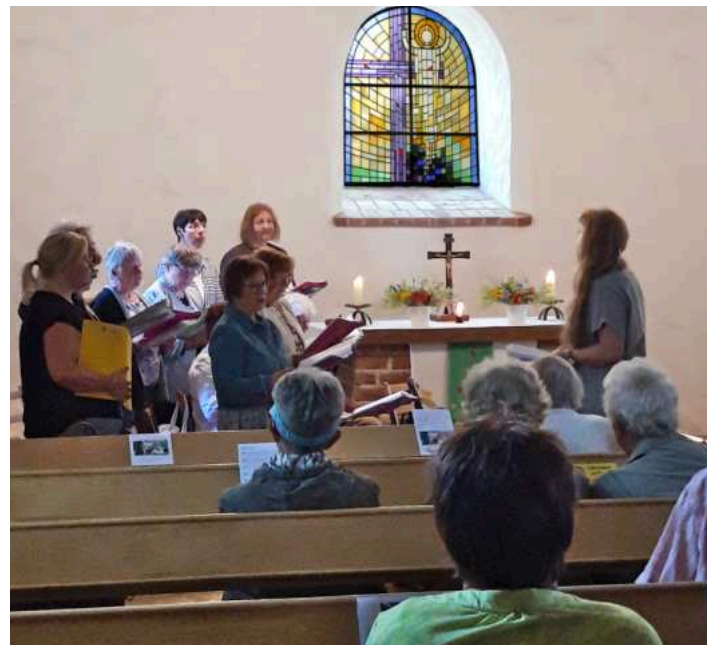
Rund 35 Gäste folgten der Einladung des Singskreises in die Groß Poseriner Kirche zum Singen, Hören und Spenden.