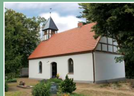
Die Kirche in Weisin war auf dem Suchbild.

Die Gewinnerin ist Frida Rudolph aus Pennewitt. Sie hat eine kreative Überraschung erhalten.