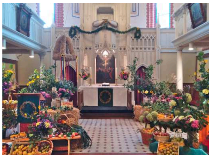
Gern erinnere ich mich an den reich geschmückten Altarraum im vergangenen Jahr zum Erntedankgottesdienst in Goldberg. [CH]

Gerne können Sie im Vorfeld Früchte Ihrer Gärten im Pfarrhaus abgeben oder in der Kirche ablegen. Wir schmücken unsere Kirche in Goldberg am Sonnabend, dem 5. Oktober um 15 Uhr. Helfer sind auch hier herzlich willkommen! [CH]