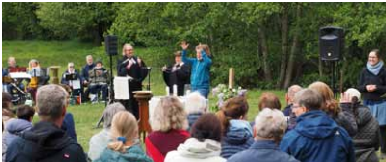
Himmelfahrt in Kösterbeck 2023