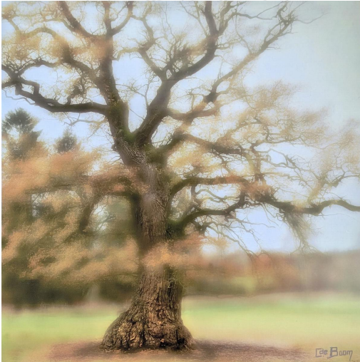
Zwischen Werden und Vergehen

So entstehen bildnerische Reflexionen der aufgenommenen Motive. Eine Suche. Eine Konfrontation. Neue Perspektiven. Auf jeden Fall entsteht eine Spannung, die uns Betrachter*innen in Zwischenräume führt: Wo fängt die Malerei an, wo hört die Fotografie auf? Was ist das eine, was das andere? Und spielt das überhaupt eine Rolle?