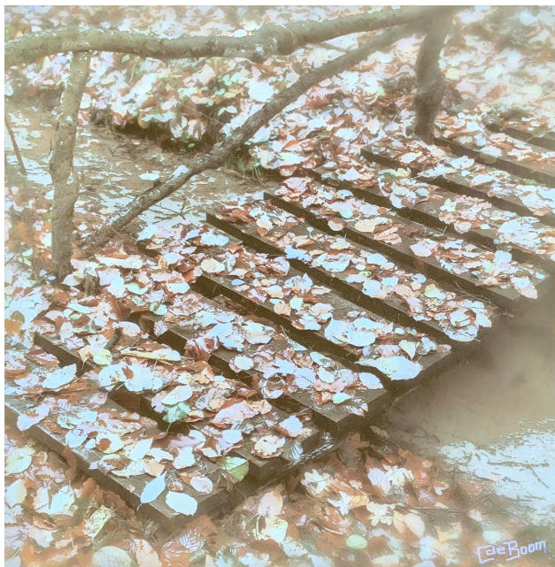
Zwischen beiden Seiten

„Das Leben wohnt im Dazwischen“ – schrieb einst der amerikanische Philosoph Alfred North Whitehead. Nicht die Schärfe, die fantasielose Präzision zeigt die Realität, sondern das eigentlich Lebendige schlummert im Dazwischen. ZWISCHENTÖNE eben!