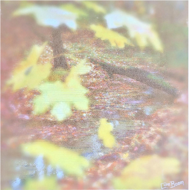
Zwischen den Tönen

„Und Adam versteckte sich mit seiner Frau vor dem Angesicht Gottes des HERRN zwischen den Bäumen im Garten.“ Aber gerade im „dazwischen“ erteilte beide Gottes Ruf: „Mensch, wo bist du?“ Ein Ruf, der ihr Leben – das Leben des Menschen in einen neuen Zusammenhang stellt.