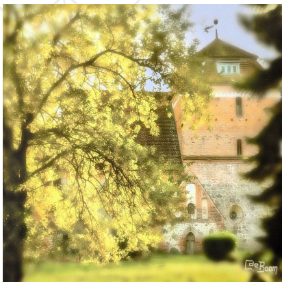
Ein Dialog zwischen Baum und Stein, heute und gestern, Mensch und Gott

Es gibt ein akustisches Dazwischen; zwischen dem, was ich sage, und was du sagst. Oft nennen wir diesen Raum Stille oder Lärm. Es gibt aber auch Zwischenräume. Die alte Dorfkirche in Bellin ist ein Zwischenraum: Fahrradfahrer aus aller Welt machen hier Pause. Füllen ihre Trinkflaschen auf. Genießen die Stille und Kühle und Andersartigkeit dieses Raums. Hinterlassen immer mal wieder Nachrichten im Gästebuch. Notizen von Gedanken, die dieser Raum anregt. Die Bewohner des Ortes kommen her und sitzen an den Gräbern der Menschen, die mal mit ihnen unterwegs waren.